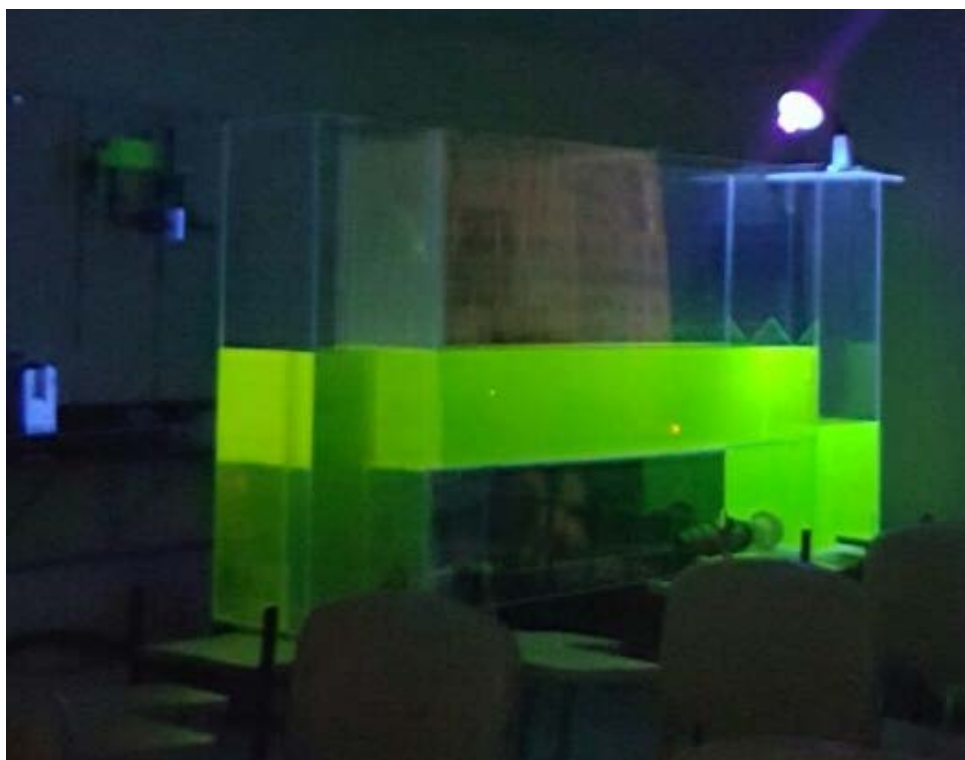
Figura 1 – Canal Hidrodinâmico: 1º teste de estanqueidade

A alimentação do canal é feita através de um conjunto motobomba a partir de um reservatório, tendo sido montados, dentro do canal, os acessórios que provocam a difusão e controle do escoamento, a saber, o vertedouro e a placa difusora.