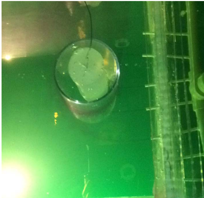
Figura 4 – Escoamento à volta de cilindro de acrílico e desaparecimento da solução de fenolftaleína.

Foram elaborados vários experimentos sobre escoamento externo em corpos rombudos (cilindros e esferas) no canal e observou-se que a utilização da solução de fluoresceína e álcool como fluido de trabalho e da fenolftaleína como solução indicadora das linhas de corrente, ambas associadas ao emprego de incidência de luz negra, foi extremamente significativa na visualização dos fenômenos, tendo em vista a referida substância indicadora desaparecer da massa fluida momentos após sua trajetória à volta dos corpos rombudos, conforme mostrado na figura 4.